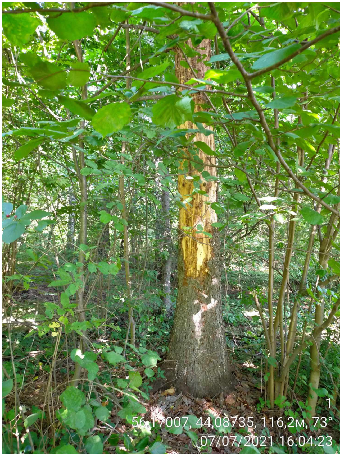
Дерево № 1 (Стволовая гниль)